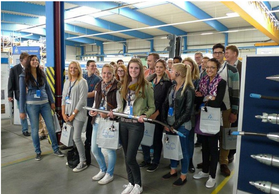
Besichtigung der Tracto Technik GmbH & Co. KG in Lennestadt durch den Arbeitskreis im Herbstsemester 2014